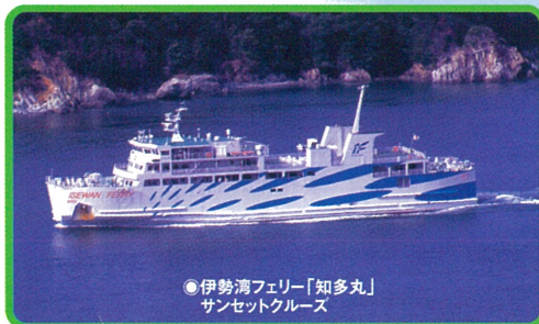
●伊勢湾フェリー「知多丸」 サンセットクルーズ