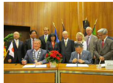
ドイツ友好都市訪問団