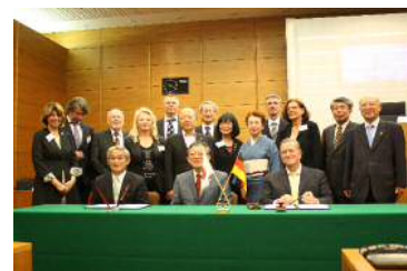
ヴォルフスブルグ市友好訪問団②