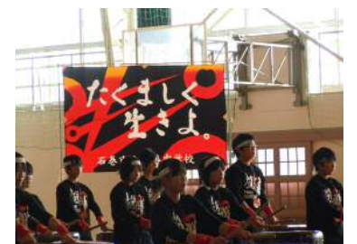
東北支援活動(復興太鼓)