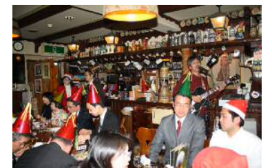
シュタムティッシュ・Xmas会