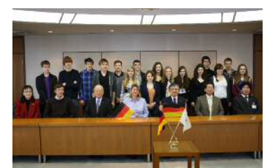
グスタフハイネマン高校一行来豊