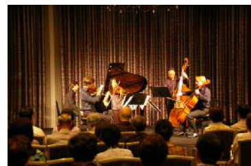
カンマーソリスト五重奏コンサート