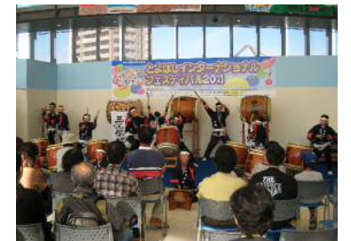
国際フェスティバル