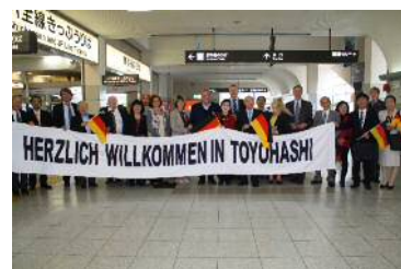
ヴォルフスブルグ市友好訪問団①