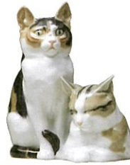
《二匹の猫》オットー・ヒルツ 1934~1940年頃 個人蔵