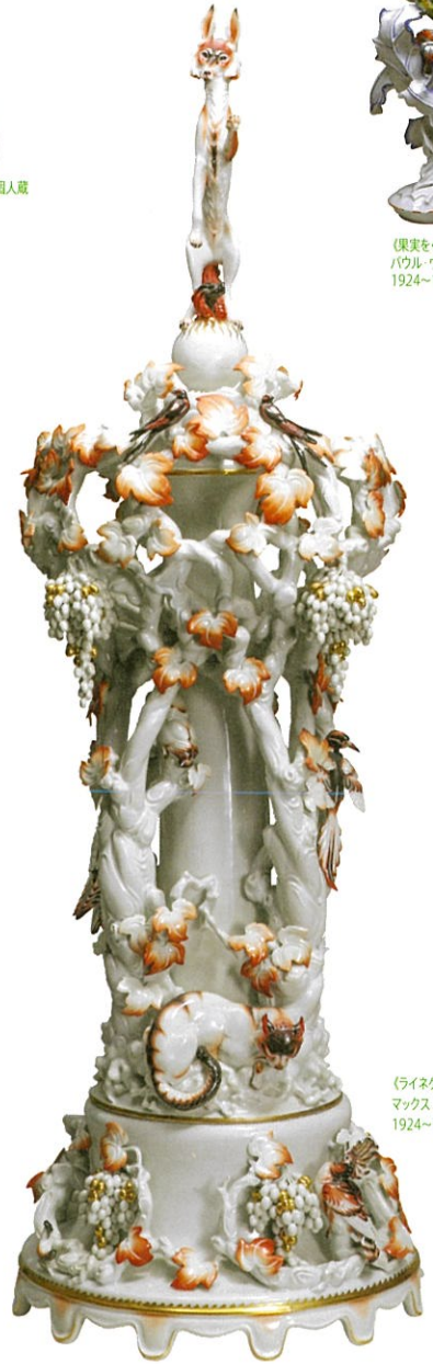
《ライネケのキツネ》 マックス・エッサー 1924~1934年頃 個人蔵