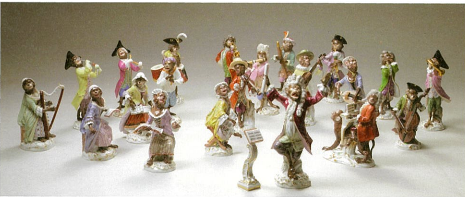
《鏡の楽団》ヨハン・ヨアヒム・ケントラーとベーター・ライニック 1820~1920年頃 個人蔵

本展は、このようなアール・ヌーヴォー期の作品を中心に構成しています。マイセンの魅力、とりわけ造形技術の高さを改めて知る機会になれば幸いです。マイセンファンはもちろん、動物好きの方や親子でお楽しみいただける展覧会です。