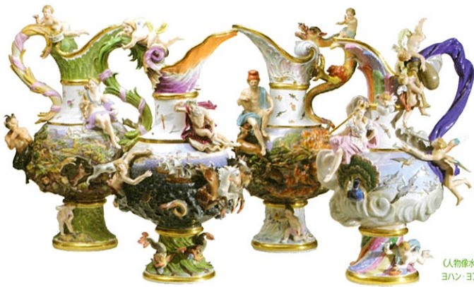
《人物像水注「四大元素の寓意」》 ヨハン・ヨアヒム・ケントラー 1820~1920年頃 個人蔵