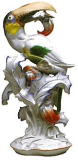
《果実をくわえたオオハシ》 パウル・ヴァルター 1924~1934年頃 個人蔵

ヨーロッパ初の硬質磁器製造に成功し、1710年に王立磁器製作所設立を布告したドイツのマイセン磁器製作所は、現在も西洋磁器のトップブランドとして高い評価を受けています。本展では、最高級の芸術性と品質を誇るマイセンの作品群から、動物に関連する作品をご紹介します。